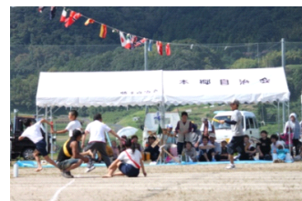
【サヨナラ親子競争】