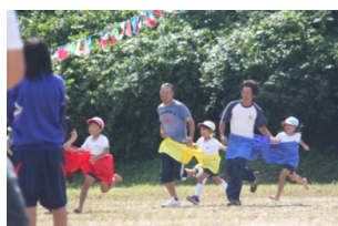
【心は一つ、親子リレー】