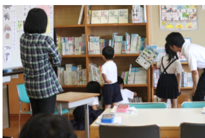
【本を探している様子】