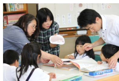
【図鑑で調べている様子】