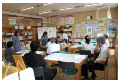
【外部の先生方や本校の教員に囲まれて】