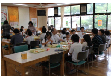
全校の子ども達と一緒に、給食を食べていただきました。