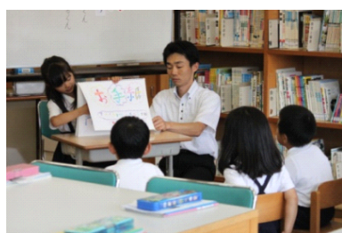
【2年生の読み聞かせ】

来校いただいた先生方からご指導をいただき、本校がこれまで取り組んできた学校図書館活用教育の方向性は適切であるという自信をもつことができました。本年度、研究主任を中心として、職員の協力体制により本校の研究のまとめをしていきたいと思ひます。