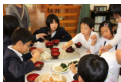
【簡単な味噌汁づくり】